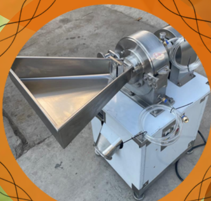
Le moulin commandé pour la mouture fine du piment

NB : la SOFRULEC est la société coopérative des producteurs des fruits et légumes créée dans la commune de Nkong-Zem, grâce à l'appui de TOCKEM.