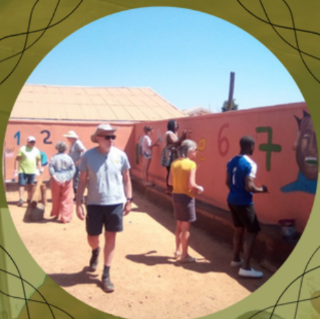
Accueil de la délégation d'ELANS