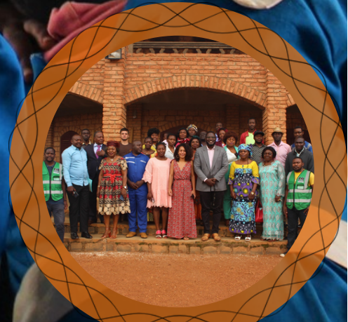
Le premier COPIL du projet