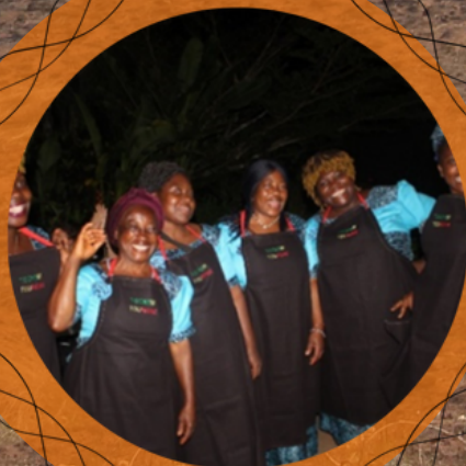
La nouvelle tenue de l'équipe