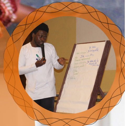
Les cours de français de la Cameroon Debate Association