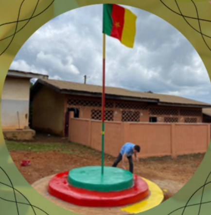
Un mât de drapeau construit