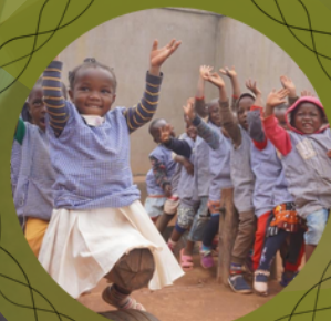
Les maternelles jouent dans leur nouvel espace de jeux