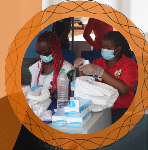
La campagne de soins d'Ascovime