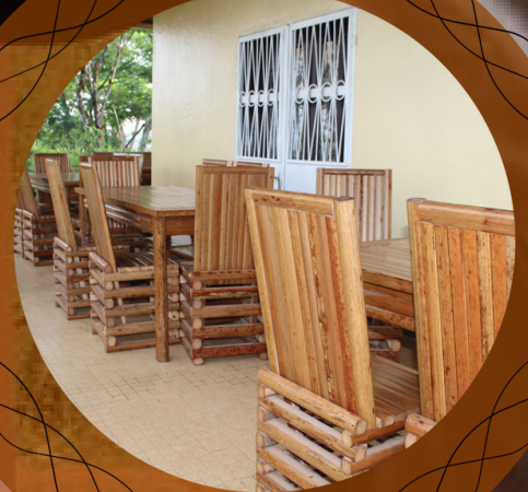
Nouvelles tables et chaises sur la terrasse