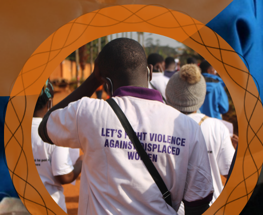
La marche contre les VBG d'APDEL