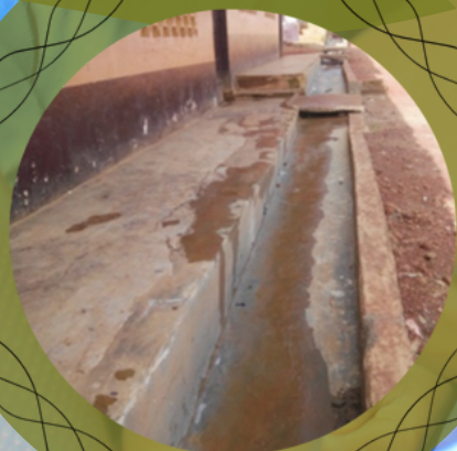
Aménagement de la rigole de la SIL au CM2