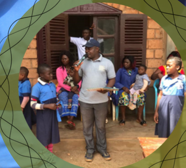
Journée du challenge inter classes