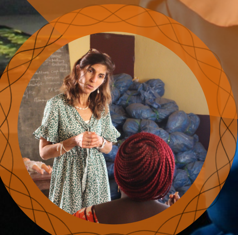
Les sensibilisations à l'allaitement de ViAllaite